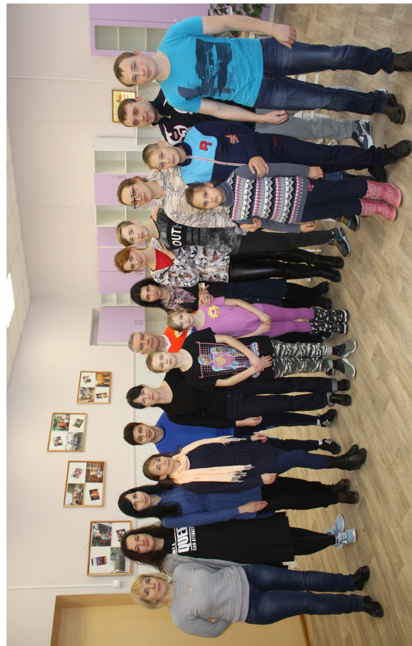
Открытие семейной гостиной