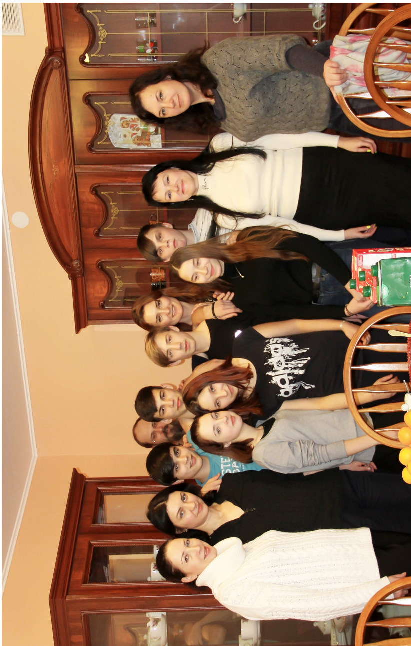
Открытие семейной гостиной