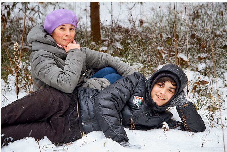
Зимой тепло, когда есть друг