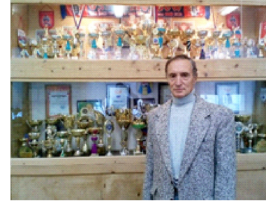
Автор: Богданов Валерий Валентинович, инструктор по физической культуре СОГБУ «Шаталовский детский дом»

Сегодня наши выпускники являются студентами высших и профессиональных учебных заведений, и очень радостно наблюдать за тем, как они продолжают и дальше общение со своими значимыми взрослыми. Потому что для наших детей наставник стал настоящим близким человеком.