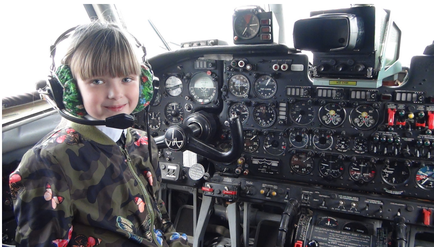
На работе у наставника